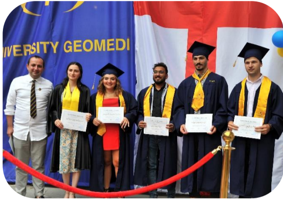
საზეიმო ტორტის გაჭრით, ქედების მაღლა აყრითა და სამახსოვრო ფოტოების გადაღებით დასრულდა.

2022 წელს უნივერსიტეტმა გეომედმა კურსდამთავრებულთა კიდევ ერთი ნაკადი საზეიმო ცერემონილით გააცვილა. ღონისძიება გახსნა და მათ გზა დაულოცა უნივერსიტეტის რექტორმა, პროფესორმა მარინა ფირცხალავამ. ღონისძიებაზე სტუდენტებს გადაეცათ სერტიფიკატები. მათ უნივერსიტეტის დამთავრება მიულოცეს ფაკულტეტის დეკანებმა, ადმინისტრაციის წარმომადგენლებმა და პროფესორ-მასწავლებლებმა. კურსდამთავრებულებმა მადლობა გადაუხადეს აკადემიურ და ადმინისტრაციულ პერსონალს განუვლი შრომისათვის. ღონისძიება